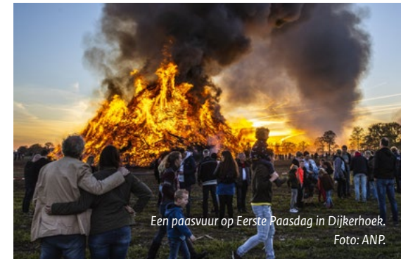
Een paasvuur op Eerste Paasdag in Dijkshoek.

Voorbeelden zijn te vinden bij vormen van immaterieel erfgoed (bijvoorbeeld piratencultuur, zendamateurs of het ambacht van voedsel conserveren) of mensen die de Zandmotor of Maasvlakte afstruinen op zoek naar archeologische vondsten en met anderen verbonden zijn in WhatsApp-groepen.