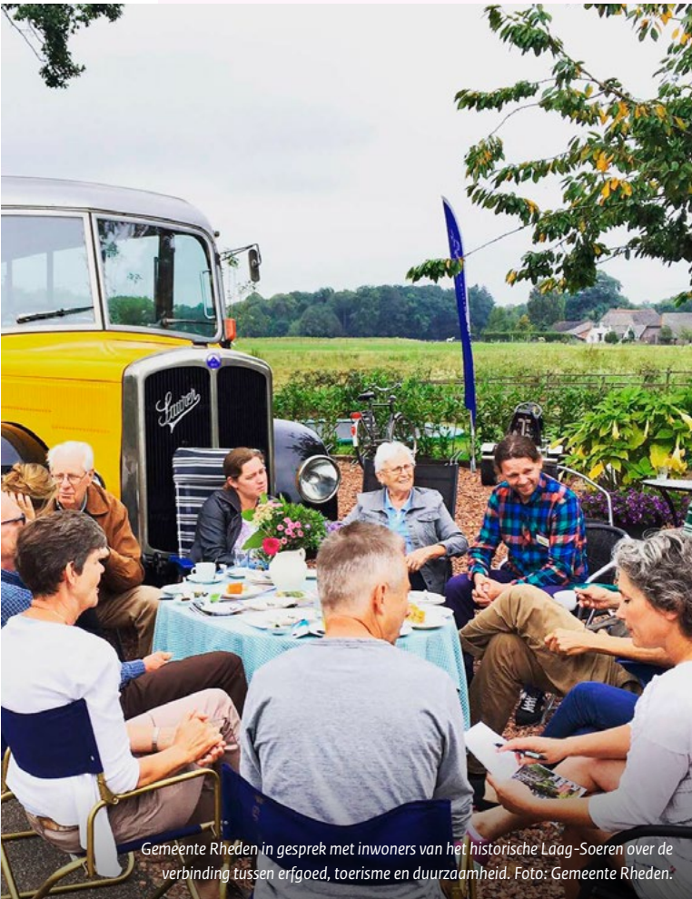
Gemeente Rheden in gesprek met inwoners van het historische Laag-Soeren over de verbinding tussen erfgoed, toerisme en duurzaamheid.

In het onderzoek is de respondenten gevraagd wat ze verstaan onder cultureel erfgoed, participatie en erfgoedgemeenschappen. De reacties zijn samengevat en geanalyseerd en vervolgens vergeleken met de definities die gebruikt worden in het Faro-verdrag en andere officiële stukken. Daarnaast worden ze aangevuld met opvattingen uit de actuele vakliteratuur.