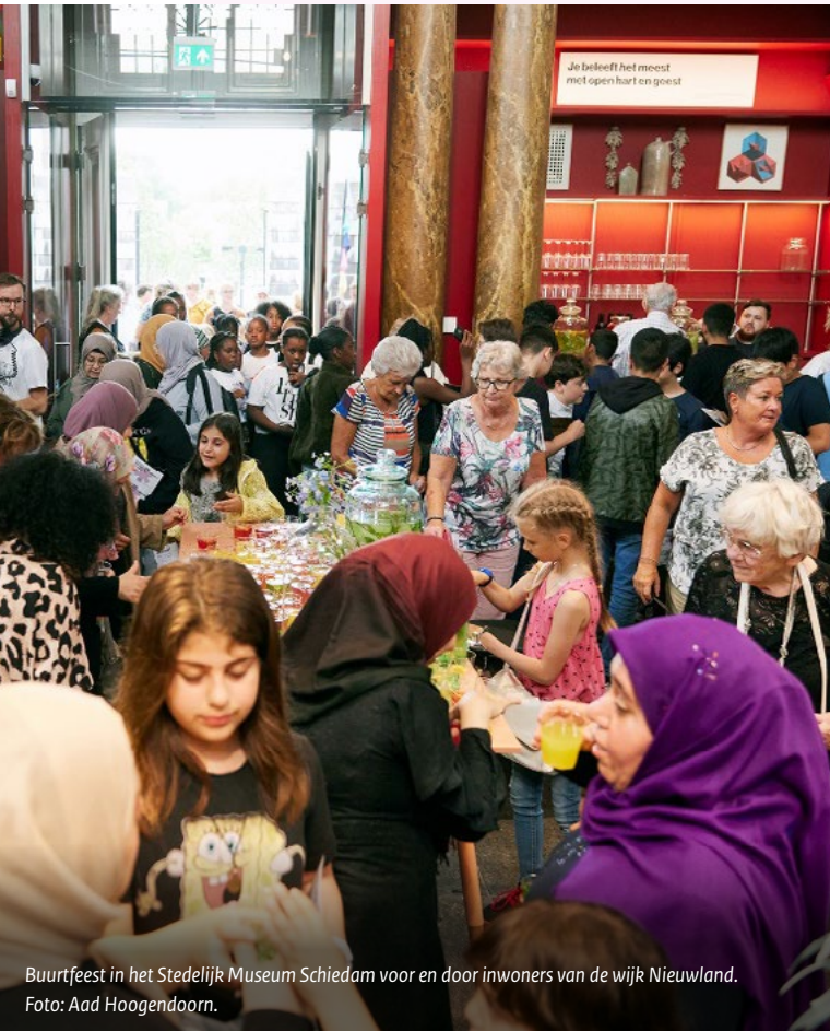
Buurtfeest in het Stedelijk Museum Schiedam voor en door inwoners van de wijk Nieuwland.

Het begrip gemeenschap is een belangrijk onderwerp van studie in de sociologie en de bestuurskunde. Die interesse komt voort uit het besef van solidariteit die eraan verbonden is: de waardering van verbondenheid tussen ‘mensen zoals wij’ . Die sociale solidariteit wordt empirisch onderzocht via begrippen als sociale cohesie, sociale netwerken en sociaal kapitaal .