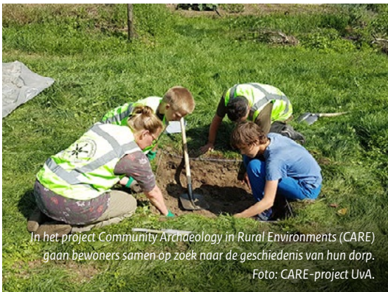
In het project Community Archaeology in Rural Environments (CARE) gaan bewoners samen op zoek naar de geschiedenis van hun dorp.

En de toelichting gaat nader in op de aard van de gemeenschappen: