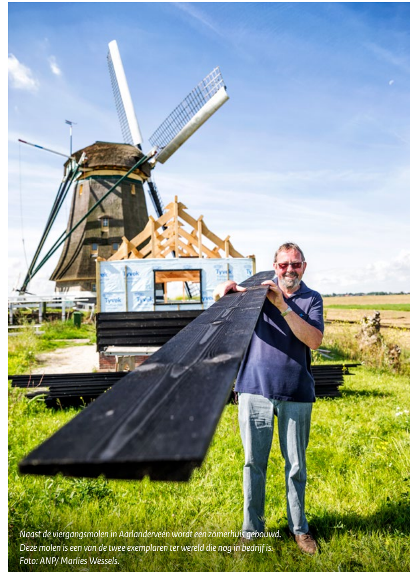
Naast de viergangsmolen in Aarlanderveen wordt een zomerhuis gebouwd. Deze molen is een van de twee exemplaren ter wereld die nog in bedrijf is.

Deze definitie is duidelijk geïnspireerd op de definitie in het Faro-verdrag. In de wettekst is het perspectief op toekomstige generaties toegevoegd aan de definitie. In de begrippenlijst (Art. 1) van de Erfgoedwet ontbreekt niettemin een verwijzing naar erfgoedgemeenschappen, of varianten, zoals vrijwilligers, deelnemers of beoefenaars.