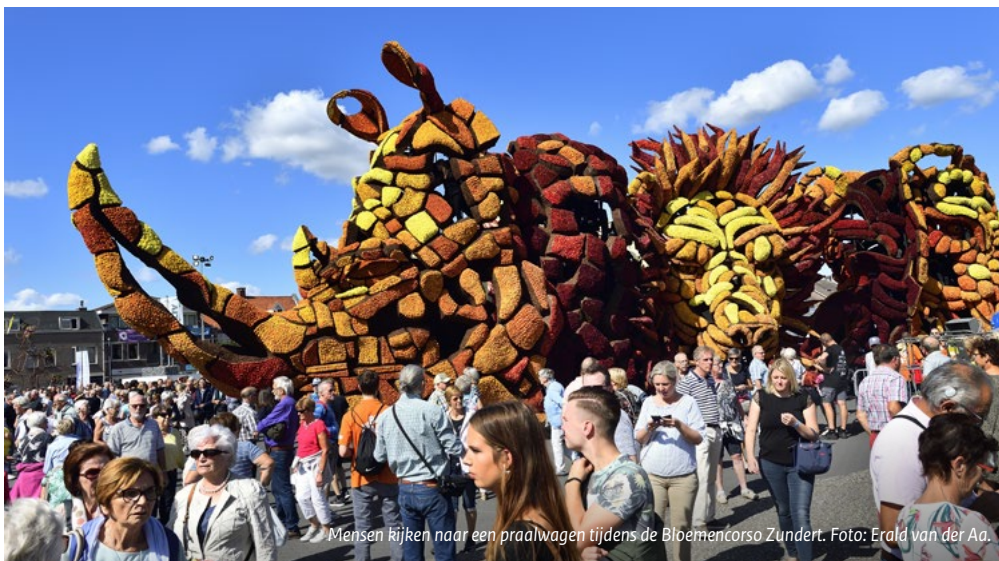
Mensen kijken naar een praalwagen tijdens de Bloemencorso Zundert.

In de Unesco-conventie over het immateriële erfgoed wordt een centrale rol toegekend aan gemeenschappen. Lees daarvoor Art. 15 waarin wordt gesteld: 'Binnen het kader van zijn beschermingsactiviteiten van het immaterieel cultureel erfgoed probeert elke lidstaat de breedst mogelijke participatie te verzekeren van gemeenschappen, groepen en, als dat wenselijk is, individuen die dat erfgoed creëren, in stand houden en doorgeven, en hen actief te betrekken bij het beheer ervan.' In een toelichting op het gebruik van het begrip erfgoedgemeenschap in de Unesco-conventie stellen Nederlandse experts op het gebied van immaterieel erfgoed: 'De nadruk op communities wil