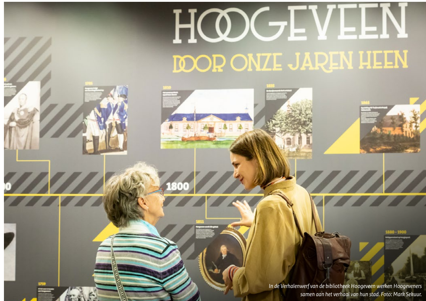
In de Verhalenwerf van de bibliotheek Hoogeveen werken Hoogeveeners samen aan het verhaal van hun stad.

Bij sociale participatie is (h)erkenning een belangrijke voorwaarde voor erfgoedparticipatie. 11 De overheid en erfgoedprofessionals bepalen voor een groot deel de legitimiteit van wat als erfgoed te bestempelen is, en daarmee wat in aanmerking komt voor erfgoedzorg. Erfgoed van gemarginaliseerde of kwetsbare gemeenschappen kan hier buitenvallen. Daarom is een open en inclusieve benadering vanuit de overheid en erfgoedprofessionals essentieel.