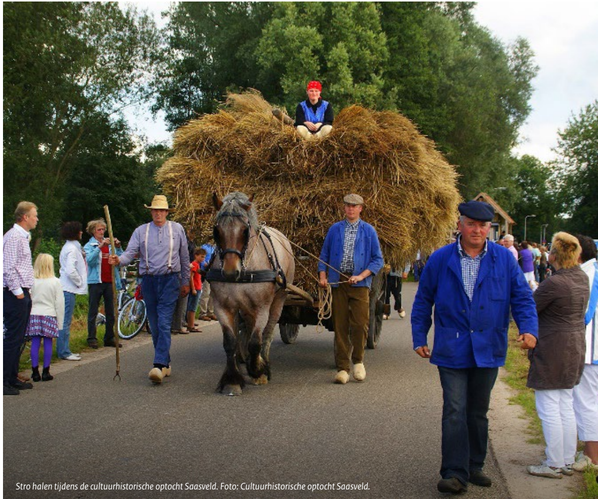
Stro halen tijdens de cultuurhistorische optocht Saasveld. Foto: Cultuurhistorische optocht Saasveld.