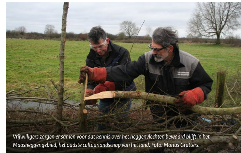
Vrijwilligers zorgen er samen voor dat kennis over het heggenvlechten bewaard blijft in het Maasheggengebied, het oudste cultuurlandschap van het land.

In het onderzoek staat: ‘In plaats van vragen op basis van welke criteria een erfgoedgemeenschap geïdentificeerd kan worden, zouden erfgoedorganisaties zich bijvoorbeeld kunnen afvragen op basis van welke eigenschappen het erfgoed en de erfgoedgemeenschap inclusiever kunnen worden. Zo transformeert het erfgoed van een object naar een middel dat de samenleving kan verbeteren en mensen centraal stelt. Erfgoedorganisaties worden de ondersteuners van dat proces.’ 22