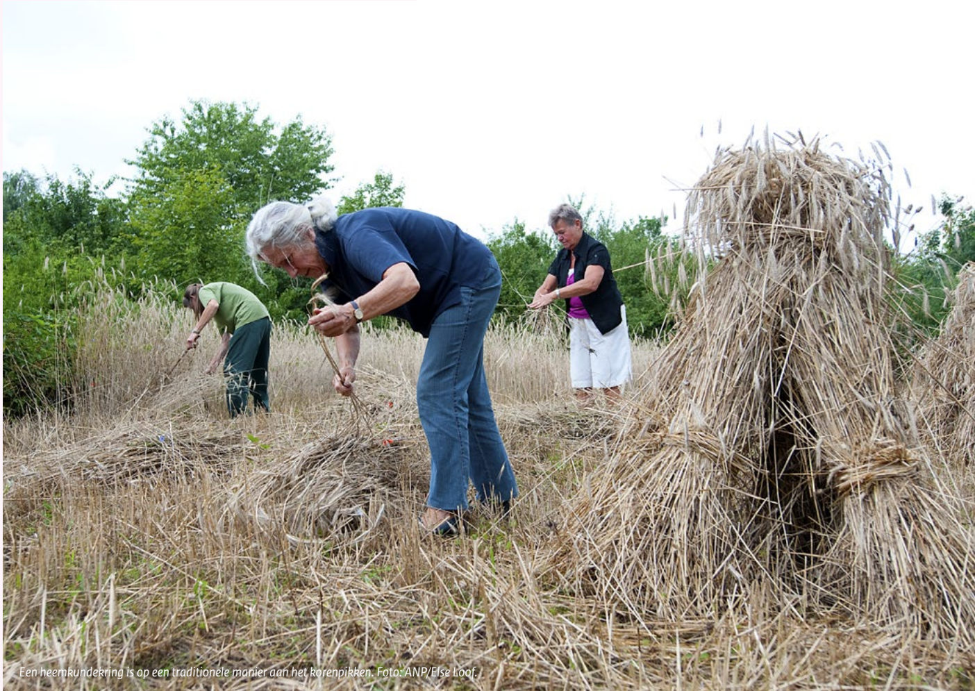
Een heemkudekring is op een traditionele manier aan het korenpikken.

Vaak worden burgers die in erfgoedprocessen participeren vrijwilliger, amateur, deelnemer of beoefenaar genoemd. 4 Als ze dat in groepsverband doen, is een ander begrip uit het Faro-verdrag bruikbaar: erfgoedgemeenschappen. Dé burger bestaat namelijk niet. Mensen verschillen sterk van elkaar, bijvoorbeeld in leeftijd, gezondheid, SES (sociaal-economische status), geslacht, opleidingsniveau, enzovoort. Die verschillen zijn sterk van invloed op de mogelijkheden tot participatie.