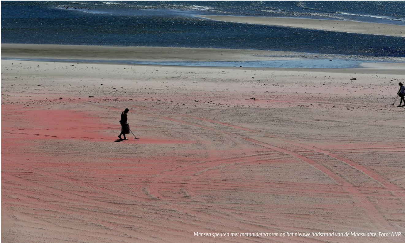
Mensen speuren met metaaldetectoren op het nieuwe badstrand van de Maasvlakte.

In de praktijk komen ook mengvormen voor. Paasvuren zijn bijvoorbeeld een mengvorm met een grote component van sociale participatie, maar vanwege de benodigde gemeentelijke vergunningen is de organisatie wel aan formele regels gebonden. Zo nemen de organisatoren van de paasvuren eveneens deel aan processen van de lokale overheid. En ook bij burgerinitiatieven komt het voor dat de overheid betrokken raakt en een ondersteunende rol vervult.